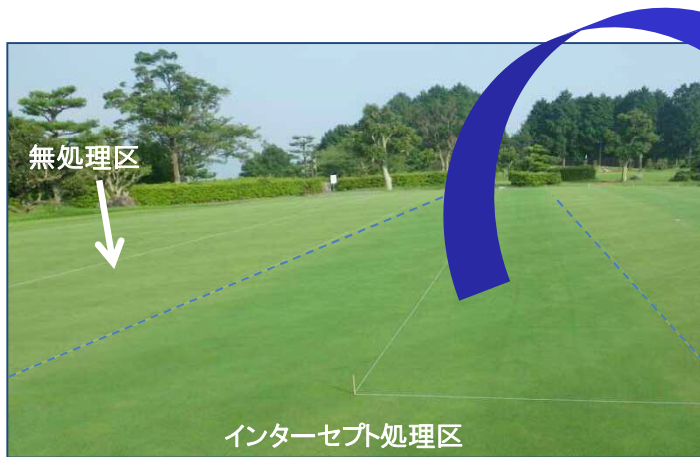
散布場所：静岡県中部地区Mゴルフ場 パッティンググリーン 散布日：2012.7.26